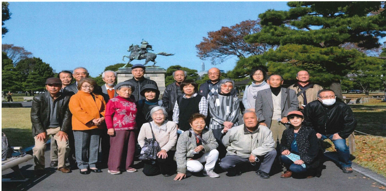
年金者連盟鎌ヶ谷支部研修旅行～皇居にて～