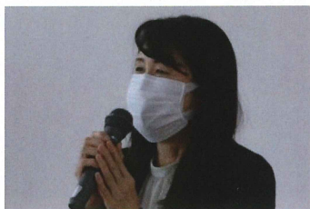
来賓 芝田市長あいさつ