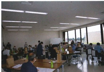
アトラクション ～抽選会～