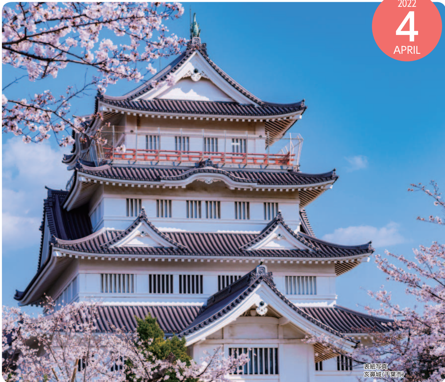
表紙写真 交鼻城(千葉市)