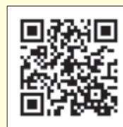
千葉縣市町村職員年金者連盟 ホームページ